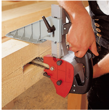
Der LS 103 Ec in horizontalem Arbeitseinsatz.