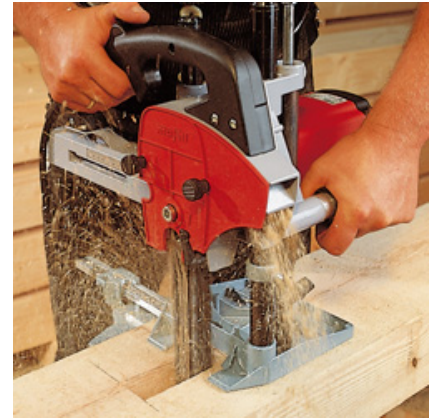
Der LS 103 Ec mit dem Führungsgestell FG 150 für Stemmtiefen bis 140 mm.