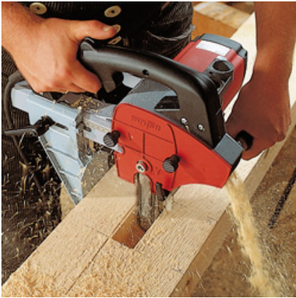
Zapfenlöcher mit dem LS 103 Ec in verschiedenen Abmessungen bis 100 mm.