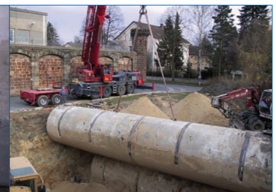
Fachgerechte Reinigung, Demontage und Entsorgung von Tankanlagen