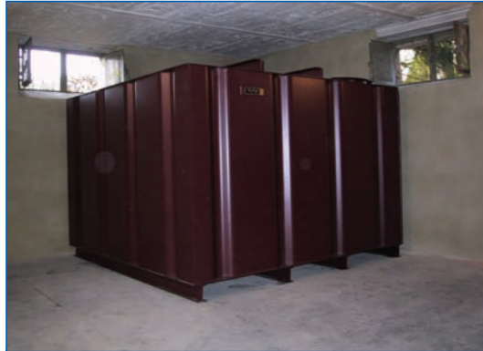
Kellergeschweißte Lagerbehälter nach DIN 6625 mit und ohne Kunststoffinnenhülle 1.000 - 100.000 Liter Inhalt

inkl. Anschluss an die vorhandene Heizung