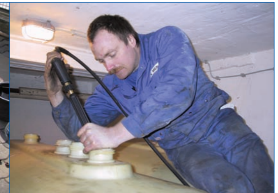
Reinigung, Wartung und Instandsetzung von Tankanlagen