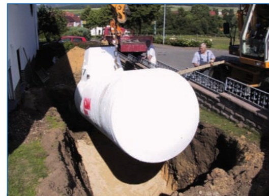
Lieferung, Einlagerung und Montage von Erdtanks incl. Erdarbeiten 1.000 - 100.000 Liter Inhalt