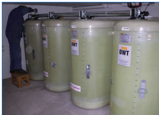
Lieferung und Montage von ein- und doppelwandigen GFK Sicherheitstanks