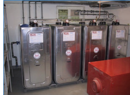
Lieferung und Montage von ein- und doppelwandigen Batterietanks